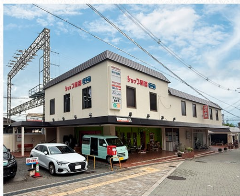
南海高野線「狭山」駅