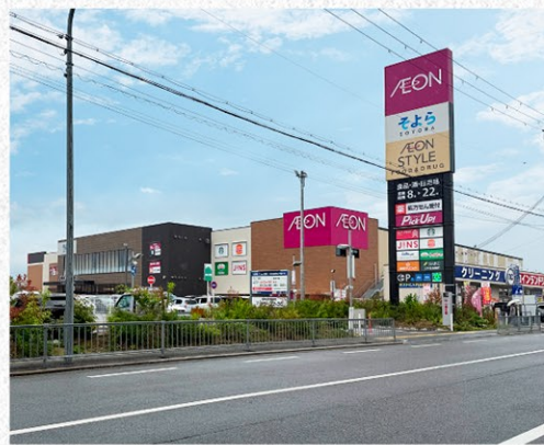
イオンスタイル(そよら)金剛