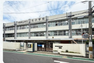
大阪狭山市立北小学校