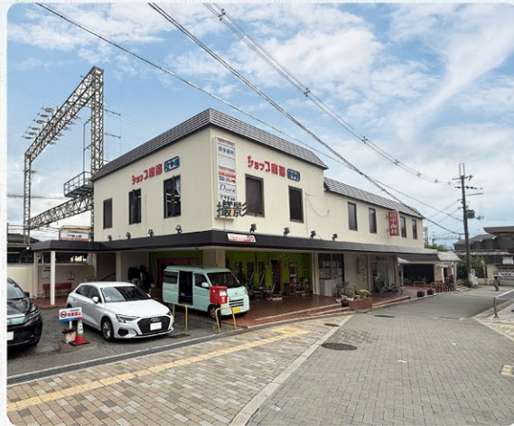
南海高野線「狭山」駅

日常の買い物施設や教育施設がコンパクトにまとまっており、治安が良く落ち着いた環境で暮らせるのが大きな魅力です。