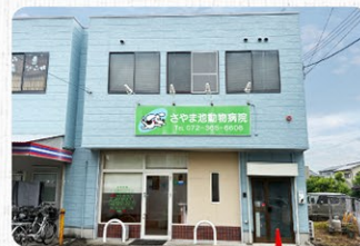
さやま池動物病院