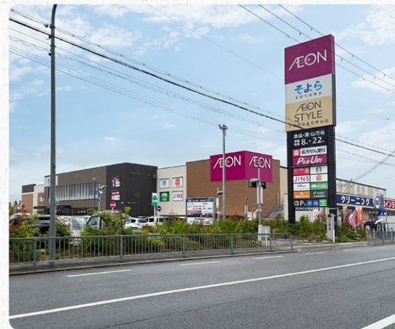
イオンスタイル(そよ)金剛