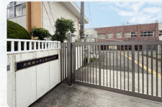
大阪狭山市立狭山中学校